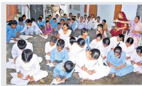
झज्जर गांव लीलाहेड़ी में स्वच्छता दिवस पर निबंध लिखते विद्यार्थी।

निर्मल भारत अभियान के तहत सोमवार को जिले के विभिन्न स्कूलों में स्वच्छता दिवस मनाया गया तथा इस अवसर पर सांस्कृतिक कार्यक्रम का आयोजन भी हुआ।