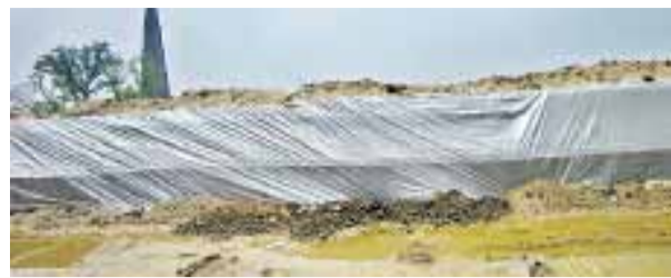
प्री मानसून की आहत से इस तरह ईंटों की सुरक्षा की जा रही है।

प्री मानसून की दस्तक से राहत पाए लोग अब ईंटों के रेट बढ़ने से परेशानी में आ सकते हैं। बरसात की रिमहिम होने से 15 दिन पहले ही अपने भट्टों को बंद करने वाले संचालक अपनी दो बवालिटों की प्रति हजार ईंट पर एक हजार से लेकर 1800 रूपए रेट बढ़ाने की मंशा में हैं। इधर समय से पहले भट्टे बंद होने पर मजदूर परिवार भी अन्य मजदूरी के लिए स्वतंत्र हो गए हैं। वे भट्टों से रवानगी लेने लगे हैं।